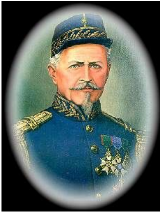
Viagem da Legião da Infantaria à Tamboril – Ceará, terra natal do Brigadeiro Sampaio Patroño da Infantaria Brasileira