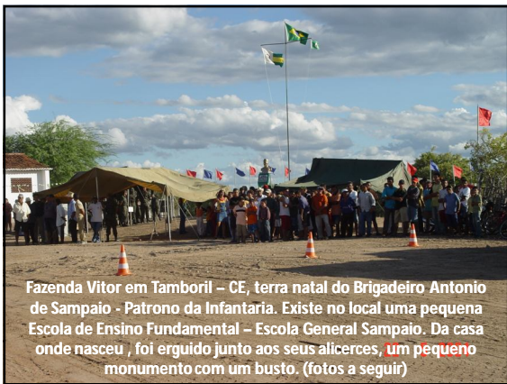
Fazenda Vitor em Tamboril – CE, terra natal do Brigadeiro Antonio de Sampaio - Patroño da Infantaria. Existe no local uma pequena Escola de Ensino Fundamental – Escola General Sampaio. Da casa onde nasceu, foi erguido junto aos seus alicerces, um pequeno monumento com um busto. (fotos a seguir)