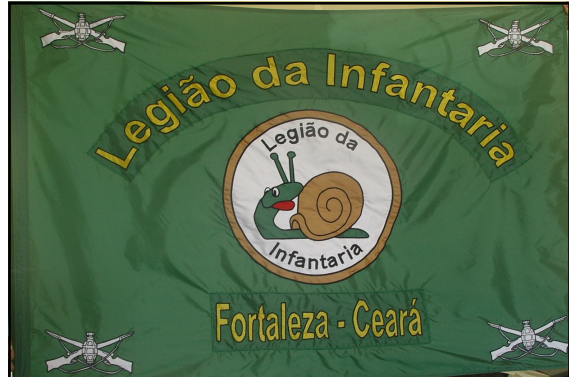
Estandarte da Legião da Infantaria / Fortaleza - Ceará